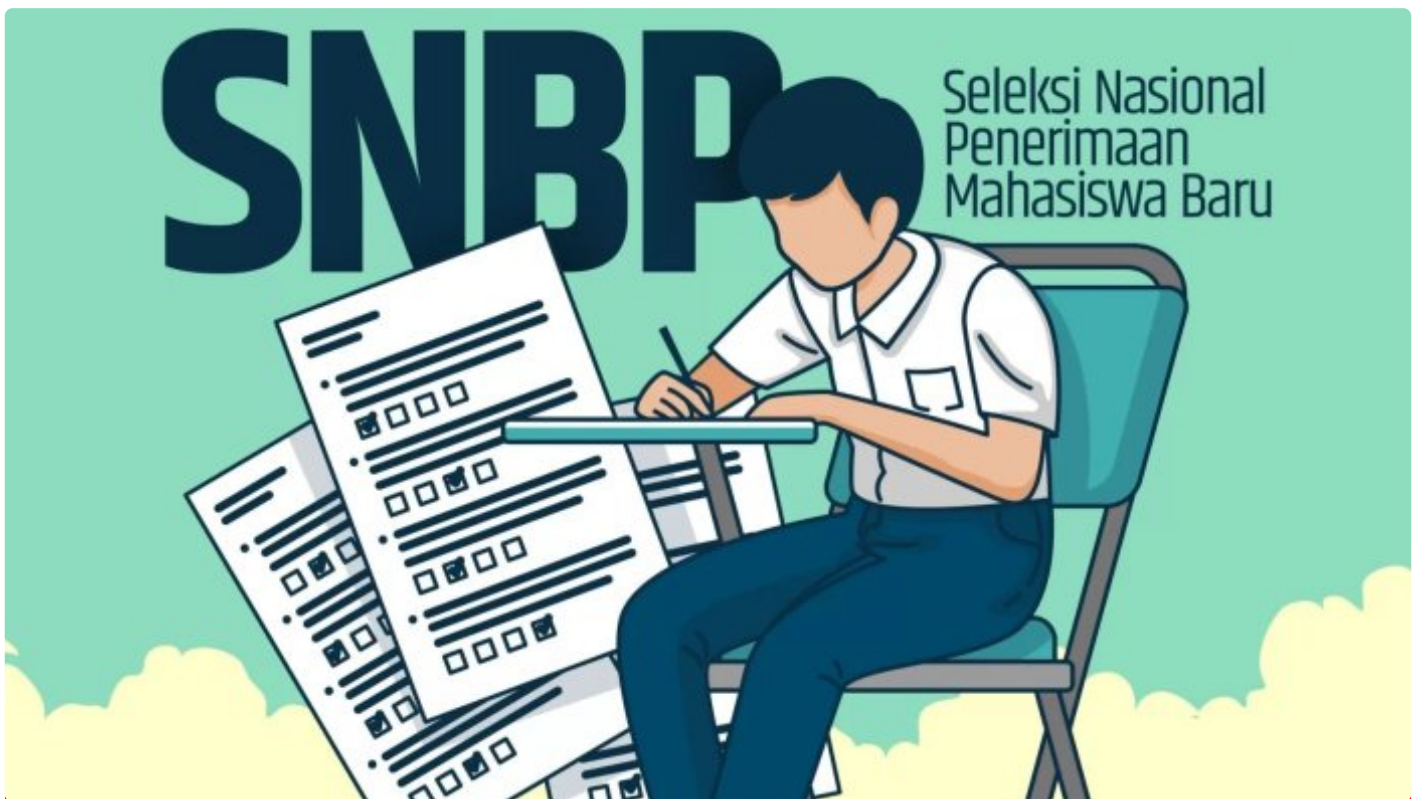
Ilustrasi seleksi SNBP

BANYUWANGI - Prestasi menggembirakan diraih siswa-siswi SMA maupun SMK di Banyuwangi. Tahun ini, jumlah siswa asal Banyuwangi yang lolos masuk Perguruan Tinggi Negeri (PTN) lewat jalur Seleksi Nasional Berdasar Prestasi (SNBP) tahun 2024 mengalami peningkatan cukup drastis dibandingkan tahun lalu.